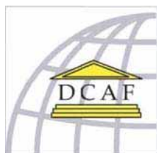
Geneva Centre for the Democratic Control of Armed Forces