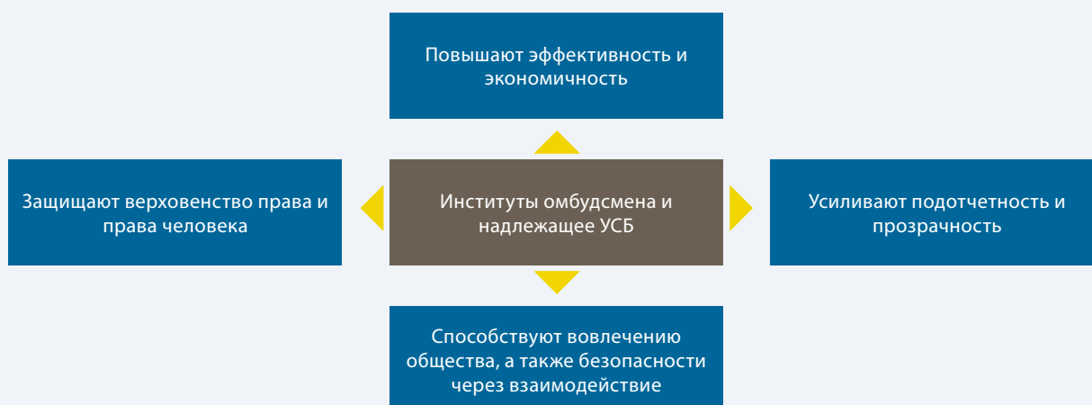
Рисунок 1. Институты омбудсмена поддерживают надлежащее УСБ несколькими путями