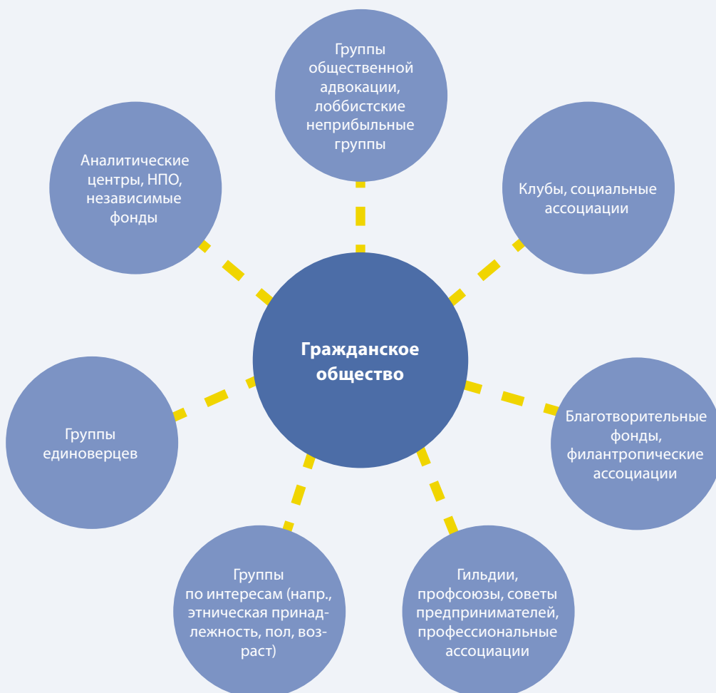
Рисунок 1. Гражданское общество включает в себя широкий спектр групп и субъектов