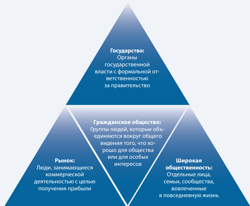
Рисунок 2. Гражданское общество существует между государством, всем населением и рынком

Группы гражданского общества формируются из-за общей проблемы или интересов, что означает, что они часто очень хорошо понимают взгляды заинтересованного населения. Если гражданское общество разрабатывает программу изменений по конкретному вопросу, оно должно лоббировать, защищать и убеждать правительство, деловой сектор или широкую общественность внести изменения, которые оно хочет видеть. Хорошо организованное гражданское общество может предоставить эффективный канал коммуникации для демократического представительства с далеко идущими последствиями для общества и безопасности.