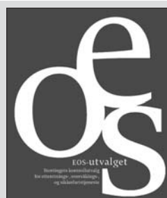
Норвезький парламентський комітет з контролю над діяльністю спецслужб