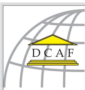
Женевський центр демократичного контролю над збройними силами (Швейцарія)