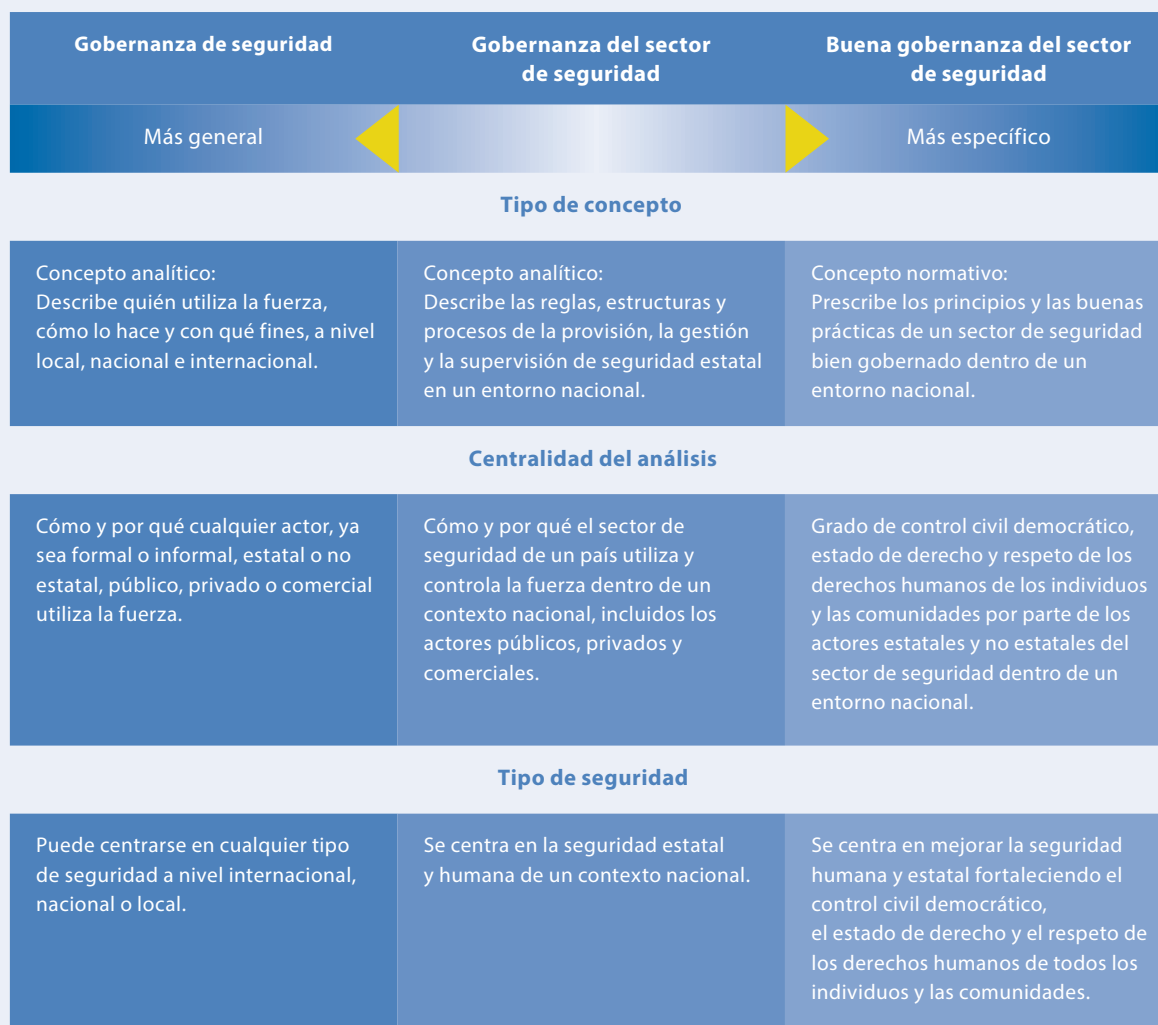
Figura 2 Diferencias entre la gobernanza de seguridad, la GSS y la buena GSS

La gobernanza de seguridad es una versión más general de la GSS que también describe el ejercicio del poder y la autoridad, pero en un contexto más amplio de seguridad internacional; la figura 2 resume las diferencias entre estos tres conceptos.