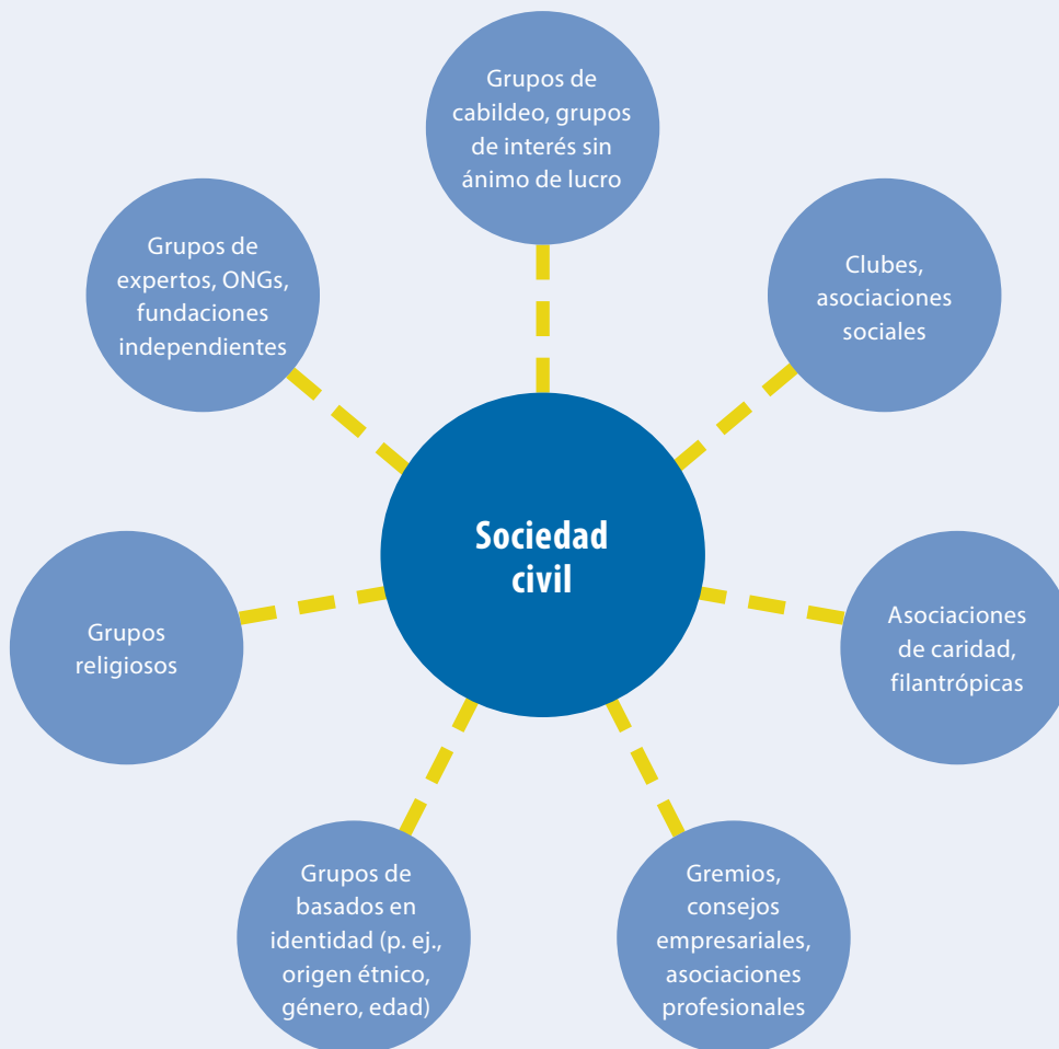
Figura 1 La sociedad civil comprende una gran variedad de grupos y actores