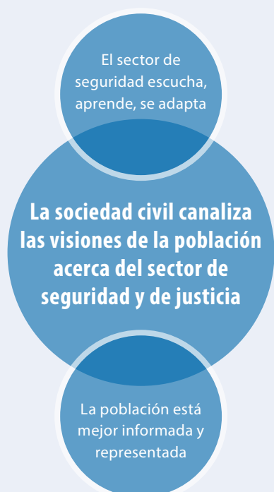
Figura 3 La sociedad civil puede ayudar a la población y al sector de seguridad a entenderse mejor

Para obtener más información sobre el rol de los medios de comunicación en la buena GSS, consulte el Documento informativo de la RSS sobre “Los medios de comunicación”.