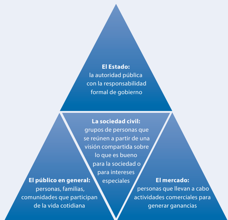
Figura 2 La sociedad civil existe entre el Estado, el público en general y el mercado

Los grupos de la sociedad civil se forman a partir de un problema o interés compartido, lo cual significa que suelen entender muy bien las visiones de la población implicada. Si la sociedad civil desarrolla una agenda para el cambio de un problema en particular, debe ejercer presión, cabildero y persuadir al Gobierno, al sector empresarial o al público en general para lograr los cambios que pretende. Una sociedad civil bien organizada puede funcionar como un canal eficaz para la representación democrática con efectos de gran alcance sobre la sociedad y la seguridad.