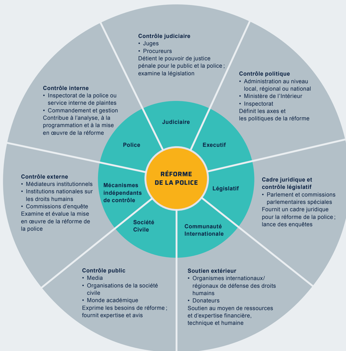
FIGURE 1 LA RÉFORME DE LA POLICE IMPLIQUE UNE VARIÉTÉ D'ACTEURS ÉTATIQUES ET NON-ÉTATIQUES