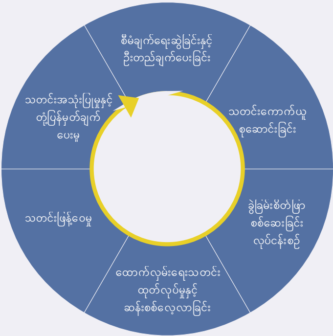
ပုံ ၂ ထောက်လှမ်းရေး သံသရာစက်ဝန်း