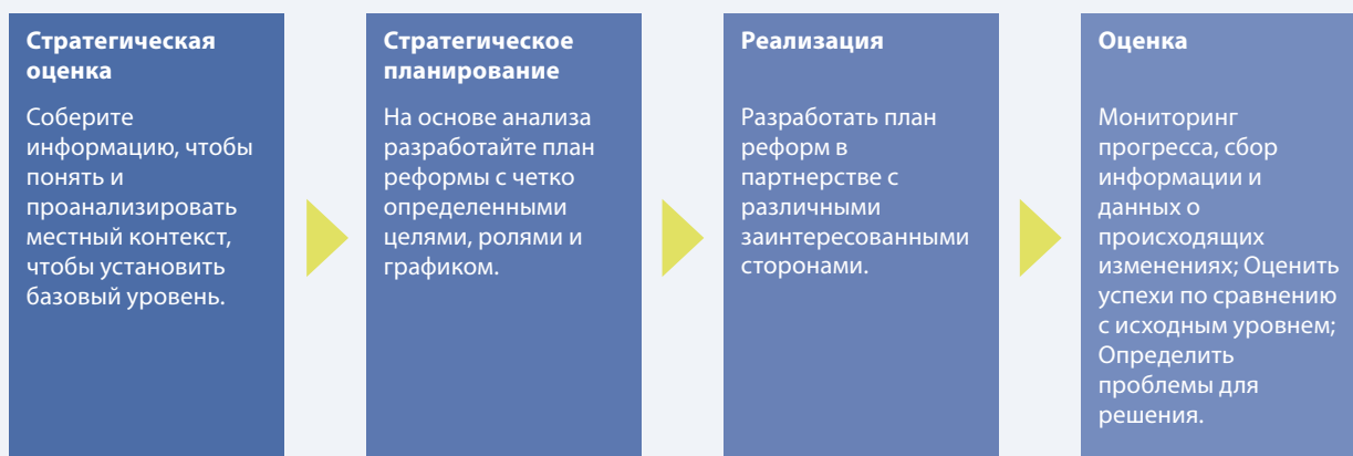
Рисунок 3. Четыре основных этапа реформы полиции

Реализация. Реализация плана реформ требует достаточной политической поддержки, финансовых и людских ресурсов, а также времени. Системный подход к управлению изменениями и эффективные стратегии внутренней и внешней коммуникации обеспечивают ясность процесса изменений и помогают получить поддержку. Реформа будет успешной только в том случае, если она имеет смысл для всего персонала полиции и тех, кто взаимодействует с полицией. Создание системы управления эффективностью и вознаграждения может цементировать изменения в ценностях и практике полиции. Преданное лидерство сверху важно. В случае смены руководства следует сохранять политическую поддержку реформ, чтобы обеспечить надлежащее выполнение плана реформ.