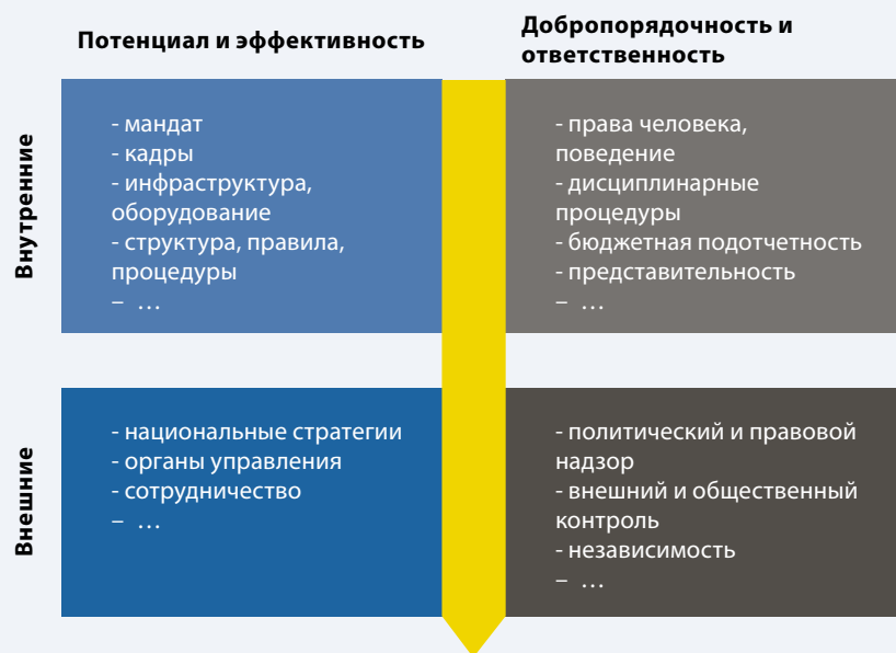
Рисунок 2. Главные цели реформы полиции для её превращения в настоящую службу