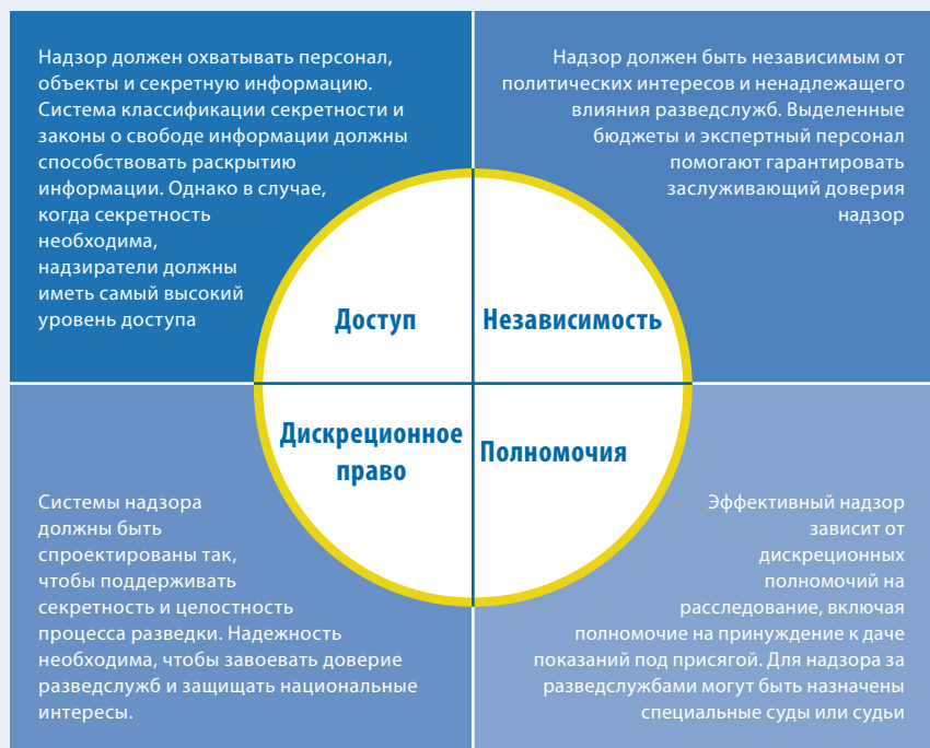
Рисунок 3. Эффективный демократический надзор за разведслужбами требует, чтобы надзиратели имели как мандат, так и полномочия для достоверной оценки работы разведслужб

Применение принципов надлежащего УСБ к обеспечению безопасности является целью РСБ. РСБ – политический и технический процесс улучшения безопасности государства и человека. Такое улучшение достигается путем повышения эффективности и ответственности при обеспечении безопасности, управлении ею и надзоре за ней в рамках демократического гражданского контроля, верховенства права и уважения прав человека. РСБ может быть сосредоточено только на одной части процесса обеспечения общественной безопасности или на том, как функционирует вся система. Однако должно соблюдаться условие: цель будет неизменно заключаться и в повышении эффективности, и в улучшении ответственности.